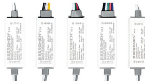
Micro Mono LED controller